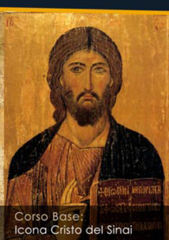
Corso Base: Icona Cristo del Sinai