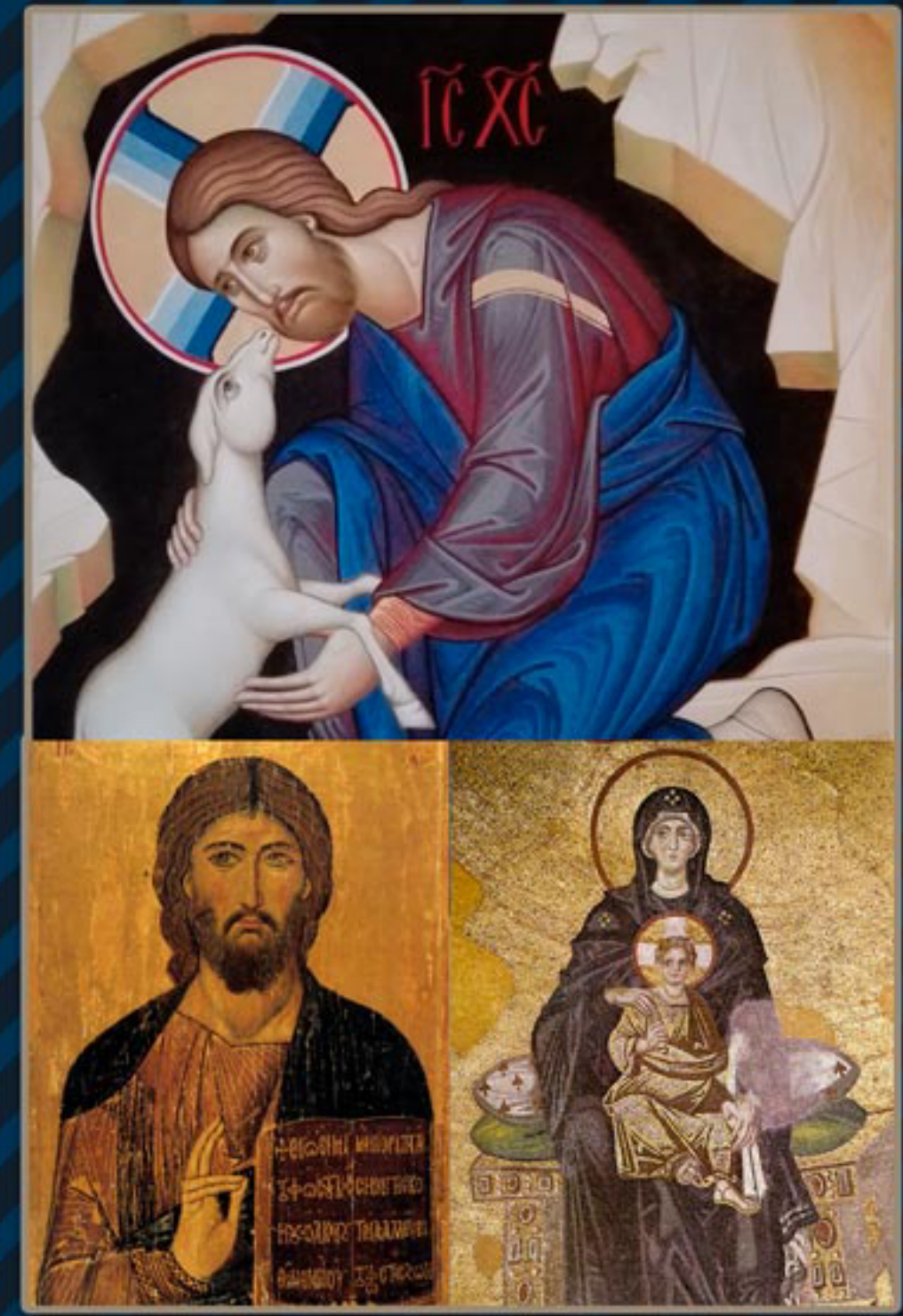
Chiesa San Bartolomeo - CAMPOBASSO

Nei caratteristici ambienti dell'antica Chiesa di San Bartolomeo, ubicata nel suggestivo Borgo Medievale di Campobasso, si terrà per il 6° anno consecutivo l'esperienza pittorica guidata dai maestri Iconografi di fama internazionale Giovanni Raffa e Laura Renzi. Ogni corso consisterà nella realizzazione di un' icona utilizzando l'antica tecnica iconografica bizantina della tempera all'uovo.