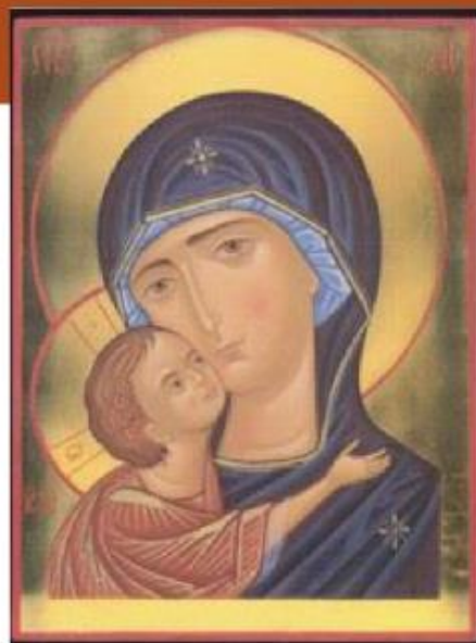
La Madre di Dio

Il corso, consente a coloro che si accostano come prima esperienza, di realizzare una tavola che ha come soggetto Il Santo Volto . Durante i giorni del corso, ogni alunno sarà guidato ad affrontare tutte le tappe che portano all'esecuzione pratica dell'icona: preparazione del disegno, utilizzo dei materiali come l'emulsione all'uovo, i pigmenti, l'oro zecchino in foglia. Ciascuno sarà introdotto anche nel significato teologico del soggetto e dei simboli.